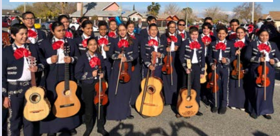
GRUPO MARIACHI DE LOS AMIGOS

La implementación de un programa de dos idiomas es una prueba que el aprendizaje de dos idiomas proporciona a los alumnos las habilidades necesarias para lograr y tener éxito no en la escuela secundaria, sino más allá. Saber dos idiomas brindará a los alumnos más oportunidades futuras. También estamos certificados por WASC. Los Amigos también tiene un énfasis STEAM, que brinda a nuestros alumnos muchas otras oportunidades, incluyendo Robótica, "Project Lead the Way" y Mariachi. Nuestro programa de alfabetización bilingüe brinda a los alumnos la oportunidad de obtener el premio "Pathway to Biliteracy". También tenemos un club ASB galardonador, programas deportivos, que incluyen voleibol, baloncesto y fútbol. ¡Vamos dragones!